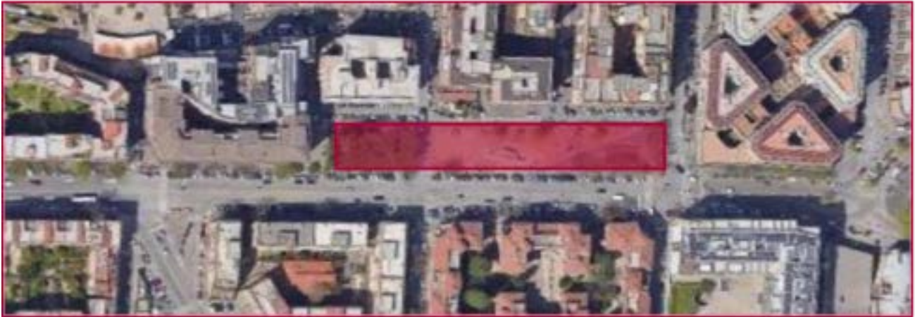
Foto aerea di piazza Ettore Rolli a Roma