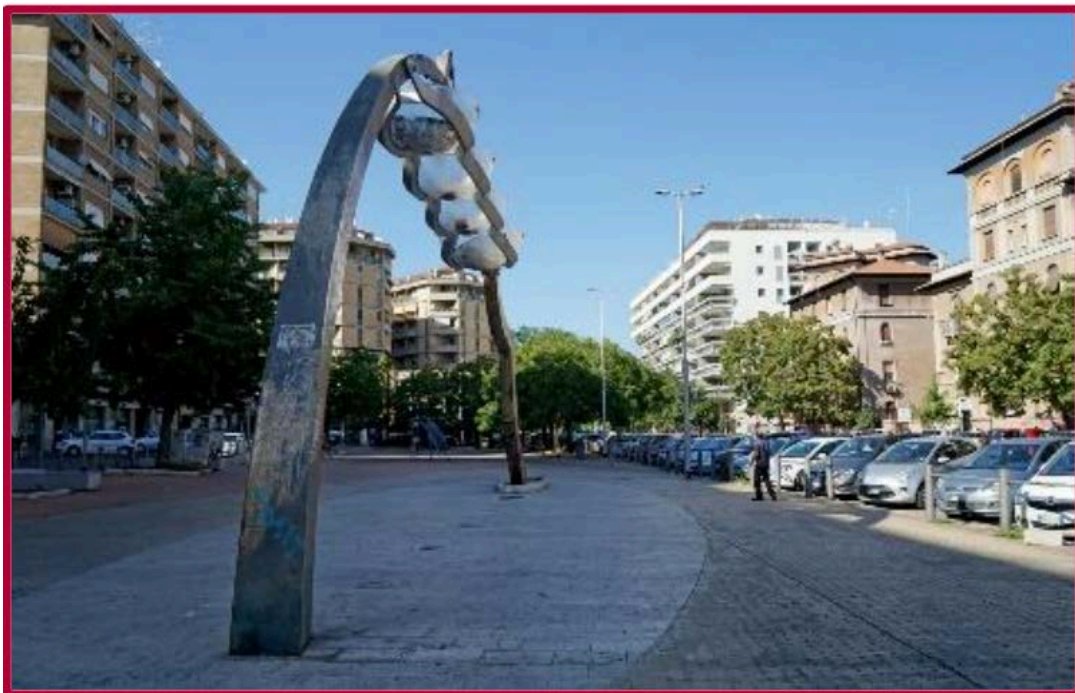
Fontana "Scultura gialla"