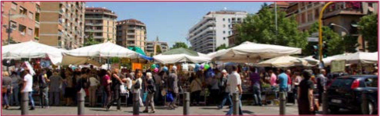
Il mercato di Porta Portese in piazza Ettore Rolli a Roma

Piazza Ettore Rolli” – area pedonale compresa tra via Ettore Rolli, via Portuense, via Carlo Porta, via Cesare Pascarella e il giardino Fernanda Gattinoni.