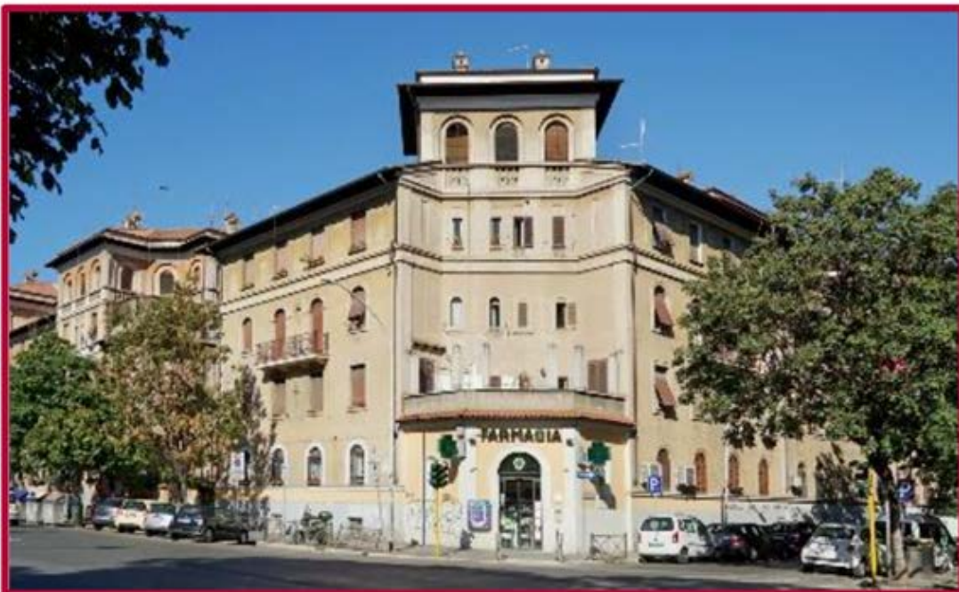
Complesso residenziale IACP