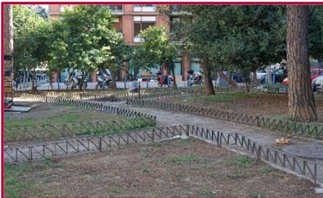
Giardino "Fernanda Gattinoni"