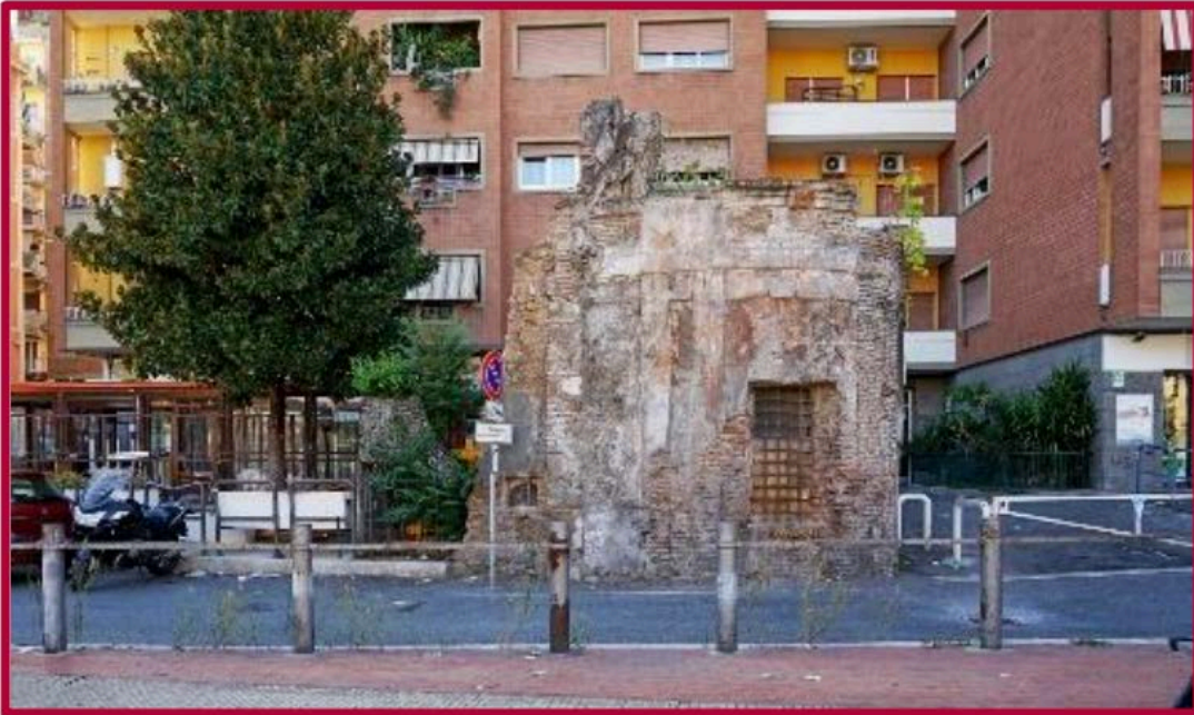
Resti della Chiesa "Madonna del Buon Riposo"